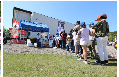
飲食ブースでファミリーライフ