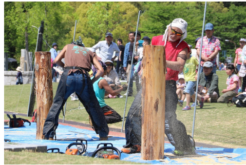
ステージで人気のチェーンソーアート