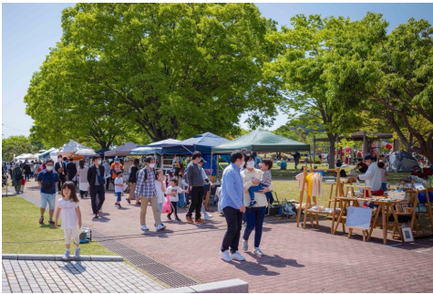
新緑の公園に並ぶ出展ブース